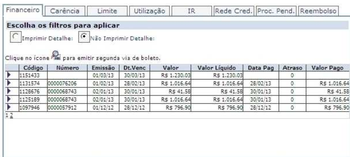
Figura4 – Aba Financeiro